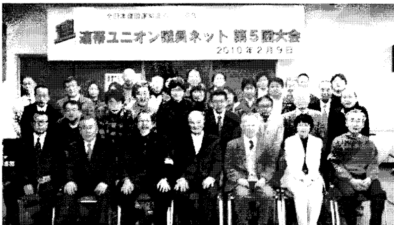
2010年・連帯ユニオン議員ネット第5回大会参加者